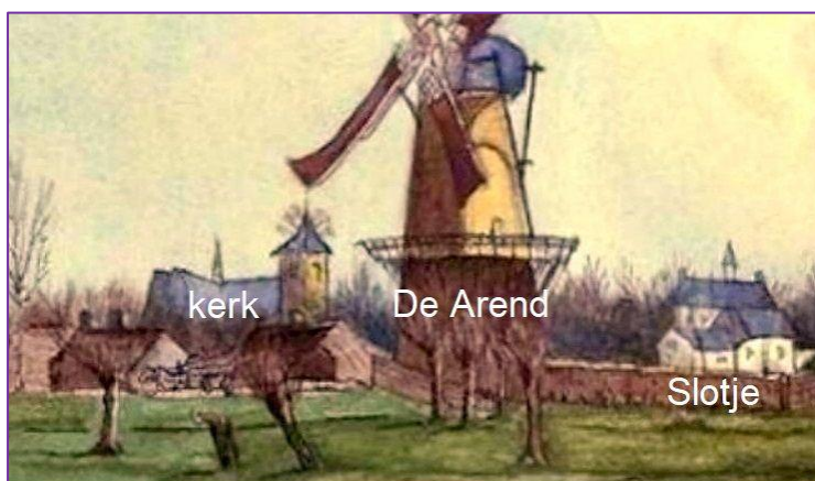
De lage torenspits met "telegraaf" in 1830

Techniek is een nuttige dienaar maar een gevaarlijke meester.